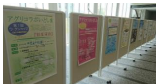
アグリコラボ 10年の歴史を展示

http://www.pref.fukuoka.lg.jp/contents/fukuoka-fukyuusidoucenta.html