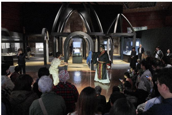
手話通訳付き劇の様子

このほか、視覚障がいのある人を対象とした観覧ツアーを閉館後の時間を活用して開催し、展示室内の照明を通常より明るくしたり、展示品のレプリカを用意し、参加者に触れたりしてもらいながら楽しめるようにしています。