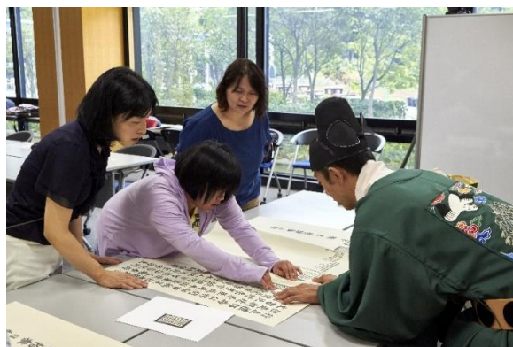
視覚障がいのある人対象のワークショップ