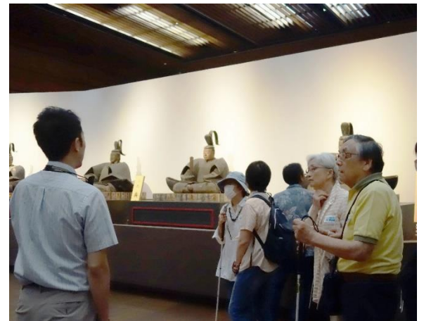
視覚障がいのある人対象の観覧ツアー

これらの実施にあたっては、アンケート等を活用して、障がいのある人の声を聞き取り、職員や学芸員、ボランティアが自ら、障がいのある人に伝わりやすく、楽しんでもらえる方法を考えるため、博物館全体の障がい理解の促進に繋がっています。