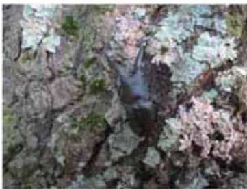
ノコギリクワガタ