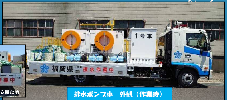
排水ポンプ車 外観（作業時）