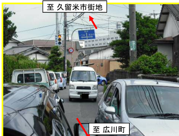
聴覚支援学校前交差点付近の状況