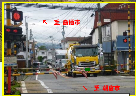
西鉄端間駅付近の踏切の状況