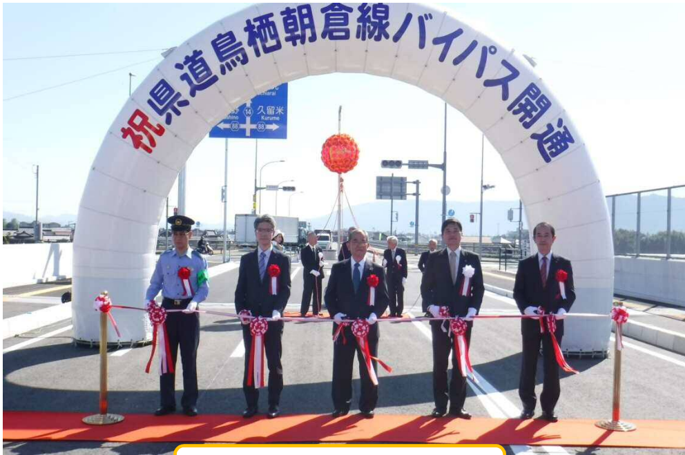
開通式(平成30年10月13日)

～ 皆様のご意見をお聞かせ下さい～ 久留米県土整備事務所 企画班 TEL : 0942-44-5344 メール : kurume-ld@pref.fukuoka.lg.jp HP : http://www.pref.fukuoka.lg.jp/soshiki/4803202.html