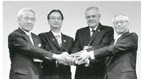
平成28年11月11日福岡県北九州市において調印。 写真左から、藏内勇夫 日本獣医師会会長、ジョンソン・チャン 世界獣医師会次期会長、ザビエル・ドゥー 世界医師会元会長、横倉義武 日本医師会会長。