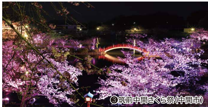
③筑前中間さくら祭(中間市)