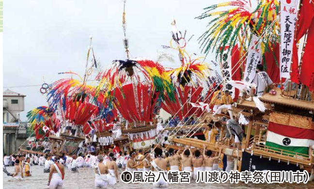
⑩風治八幡宮 川渡り神幸祭(田川市)