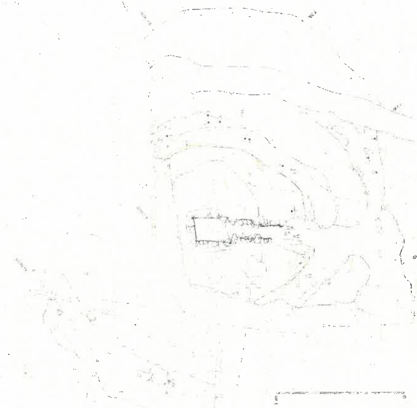
皆見大塚古墳平面図