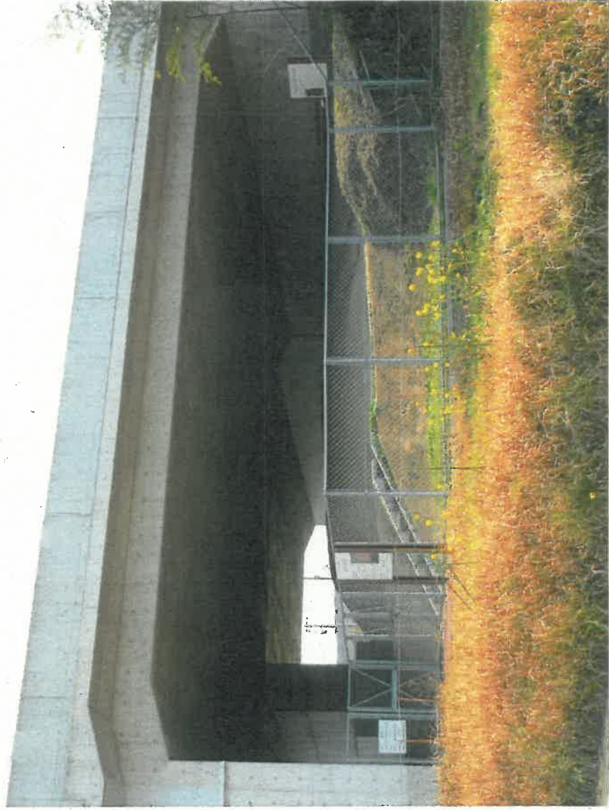
皆見大塚古墳現況（南西から）