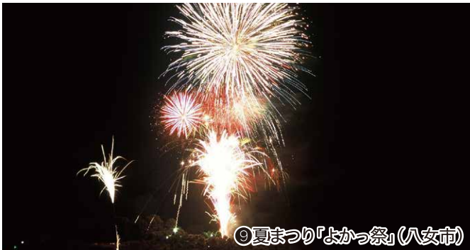
⑨夏まつり「よかつ祭」(八女市)

問 北九州市立美術館 ☎093-882-7777 ファクス093-861-0959