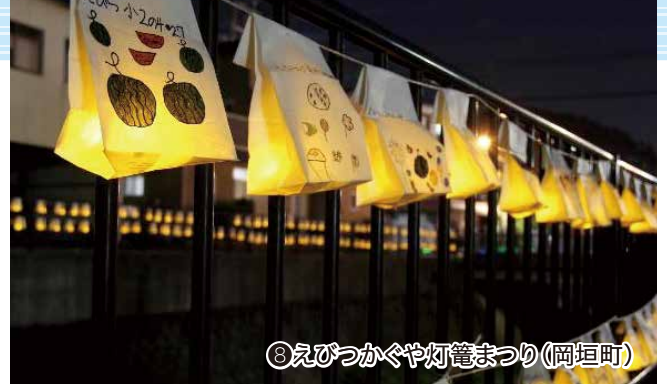
⑧えびつかぐや灯籠まつり(岡垣町)