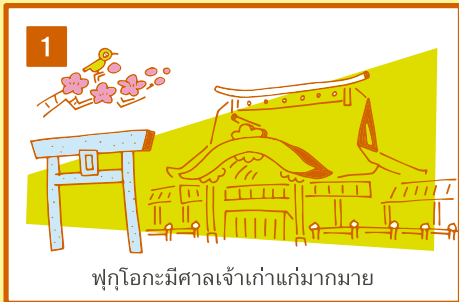
ฟูโกะมีศาลเจ้าเก่าแก่มากมาย