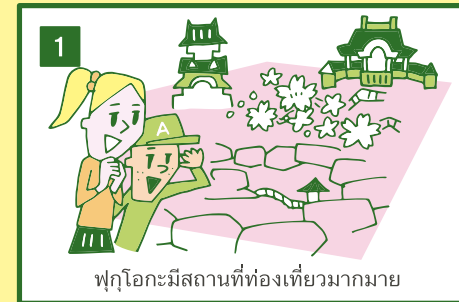
ฟูโกะมีสถานที่ท่องเที่ยวมากมาย