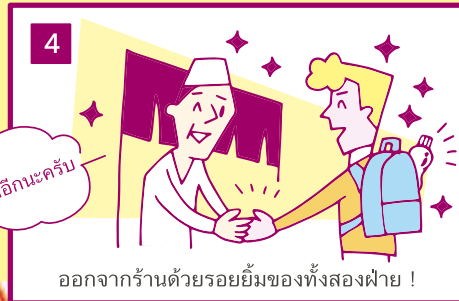
ออกจากร้านด้วยรอยยิ้มของทั้งสองฝ่าย!