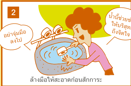
ล้างมือให้สะอาดก่อนสักการะ