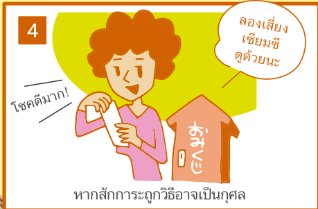
หากสักการะถูกวิธีอาจเป็นกุศล