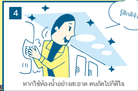
หากใช้ห้องน้ำอย่างสะอาด คนถัดไปก็ดีใจ