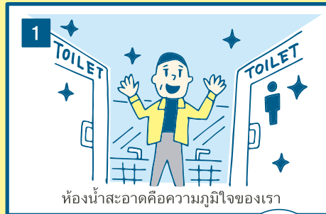
ห้องน้ำสะอาดคือความภูมิใจของเรา