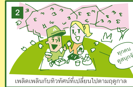
เพลิดเพลินกับทิวทัศน์ที่เปลี่ยนไปตามฤดูกาล