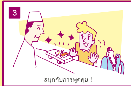
สนุกกับการพูดคุย!