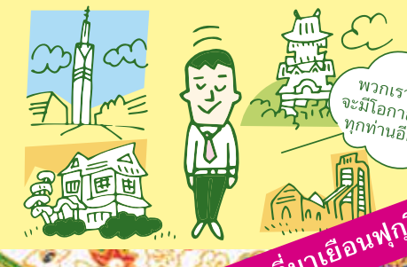
พวกเราหวังว่าจะมีโอกาสต้อนรับทุกท่านอีกครั้ง!