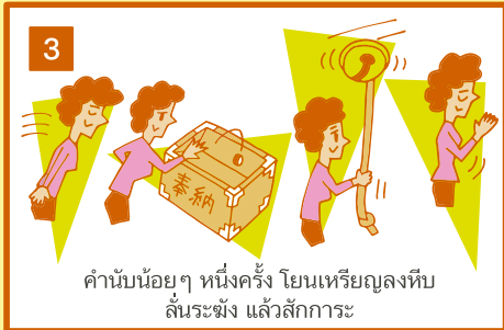
ค่านับน้อยๆ หนึ่งครั้ง โยนเหรียญลงหีบสั้นระฆัง แล้วสักการะ