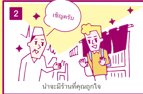
น่าจะมีร้านที่คุณถูกใจ