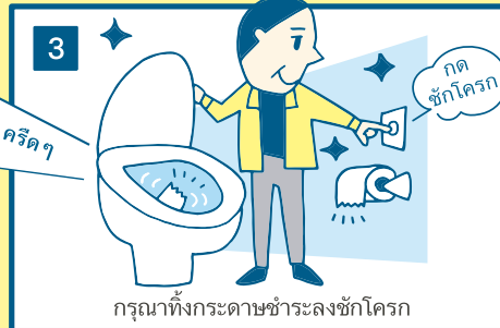
กรุณาทิ้งกระดาษชำระลงชักโครก