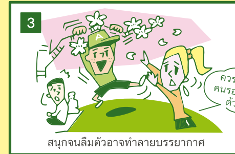
สนุกจนลืมตัวอาจทำลายบรรยากาศ