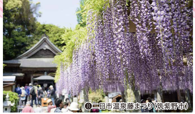
⑧三田市温泉藤まつり(筑紫野市)