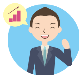
登録団体・事業所数 3734団体 (平成30年12月31日時点)

◎登録団体・事業所の情報など詳しくは「ふくおか健康づくり県民運動情報発信サイト」(3ページ参照)で紹介しています