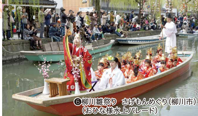
⑥柳川雛祭り さげもんめぐり(柳川市) (おひな様水上パレード)