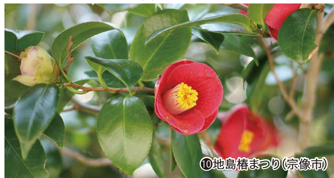
⑩地島椿まつり(宗像市)