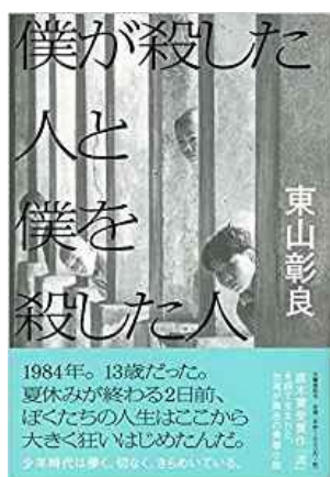
『僕が殺した人と僕を殺した人』