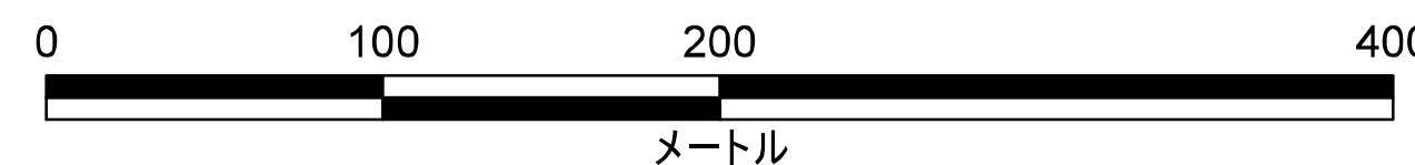
津波災害警戒区域 区域図

この地図の作成に当たっては、国土地理院長の承認を得て、同院発行の数値地図(国土基本情報)電子国土基本図(地図情報)を使用した。(承認番号 平29情使、第1125号)