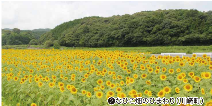
②なひこ畑のひまわり(川崎町)