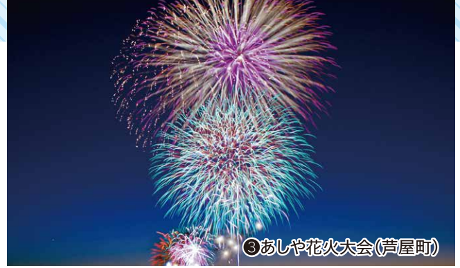
③あしや花火大会(芦屋町)