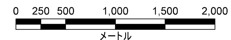
津波災害警戒区域 位置図

この地図の作成に当たっては、国土地理院長の承認を得て、同院発行の数値地図(国土基本情報)電子国土基本図(地図情報)を使用した。(承認番号 平29情使、第1125号)