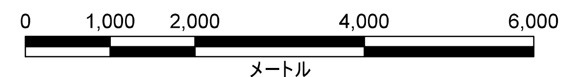
津波災害警戒区域 位置図

この地図の作成に当たっては、国土地理院長の承認を得て、同院発行の数値地図(国土基本情報)電子国土基本図(地図情報)を使用した。(承認番号 平29情使、第1125号)