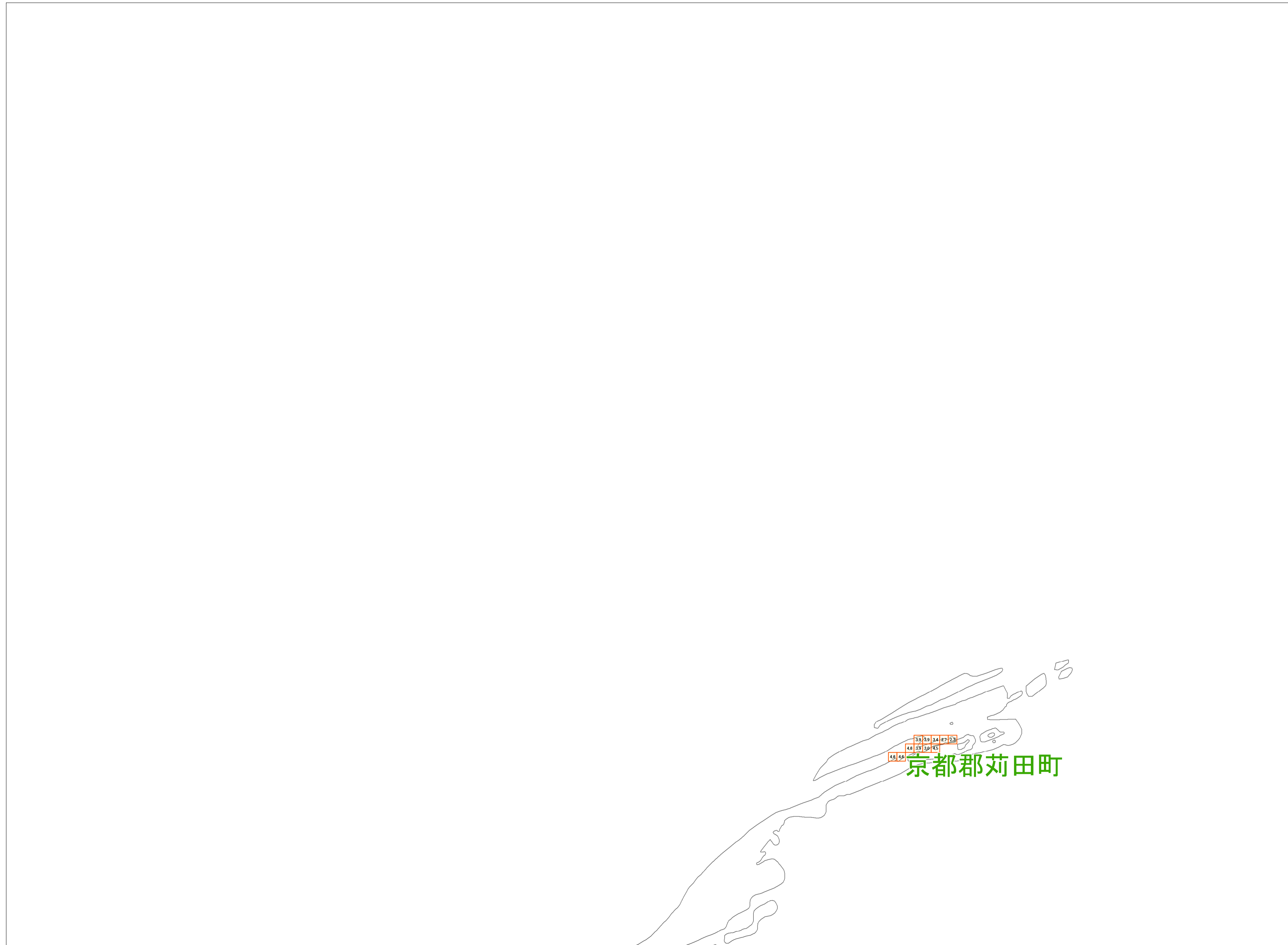
この地図は、苅田町長の承認を得て、同町所管の測量成果を複製して作成したものである。