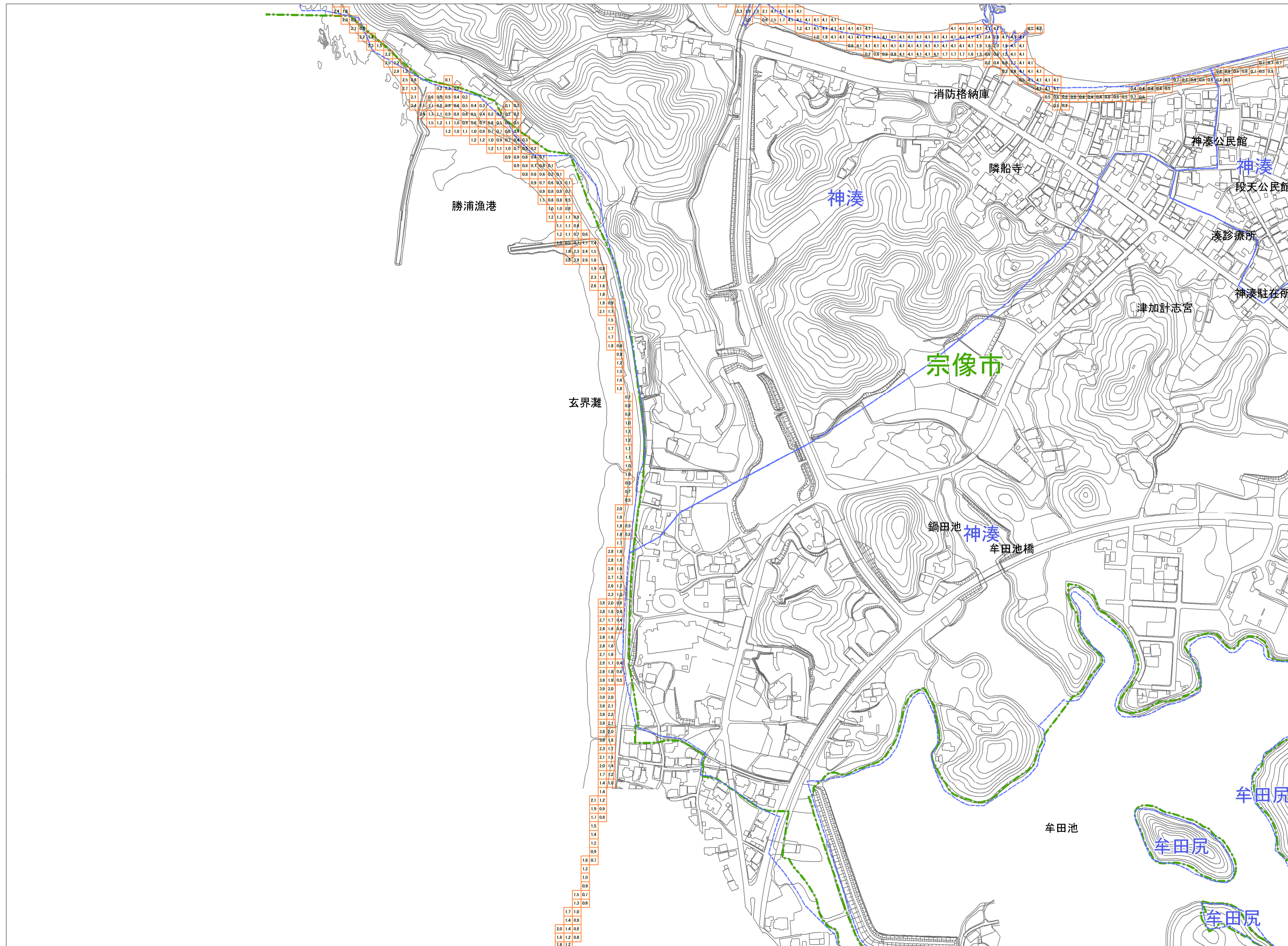
この地図は、宗像市長の承認を得て、同町所管の測量成果を複製して作成したものである。