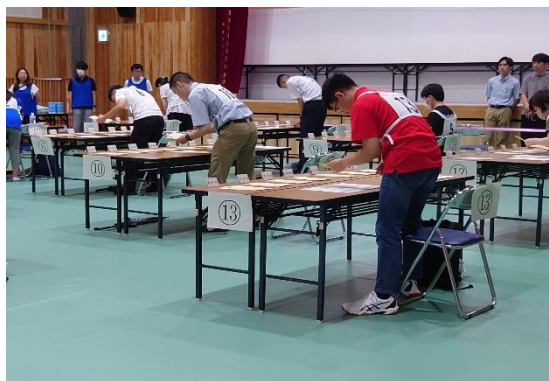
オフィスアシスタント