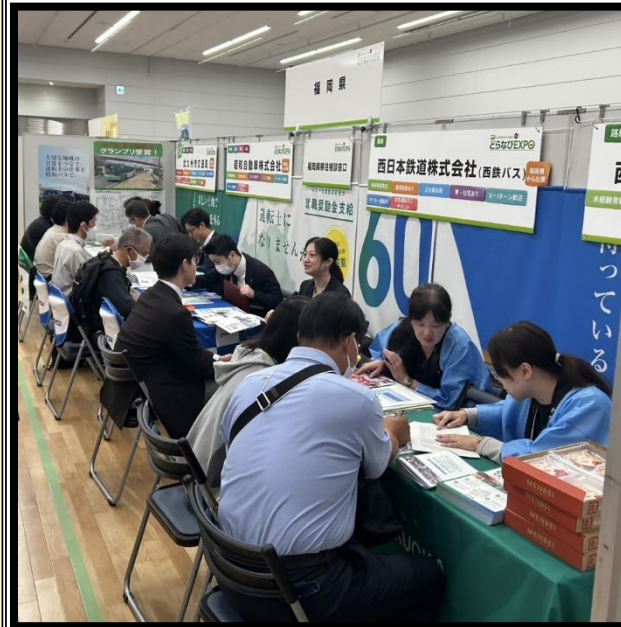
▲どらなびEXPO(東京会場)