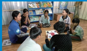
カンボジア：若者中心のワークショップ