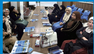
イラク：指導者対象の薬物乱用防止研修