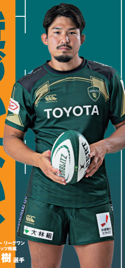
ジャパンラグビーリーグワントヨタヴェルブリッツ所属 姫野和樹 選手