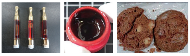
大麻リキッド 大麻ワックス 大麻クッキー

「大麻リキッド」「大麻ワックス」など大麻から幻覚成分を抽出・濃縮した加工品が摘発されています。また海外旅行のお土産としてもらったものでも違法です。