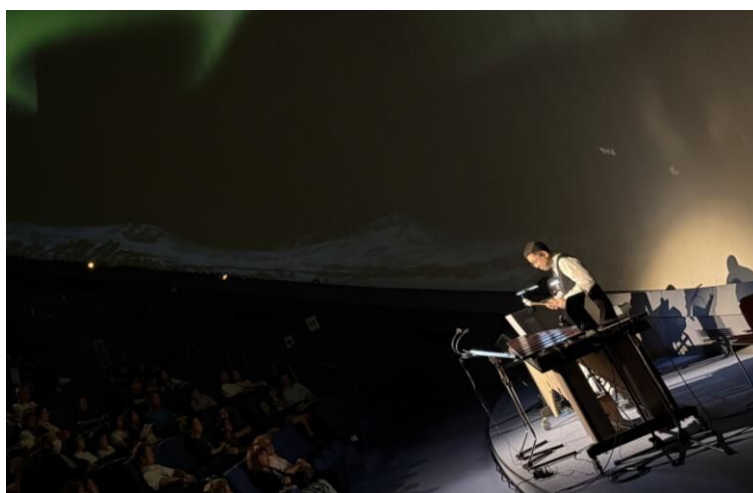
令和7年度アクロス・ミュージックキャラバン in 福岡県青少年科学館 より

アクロス・ミュージックキャラバンは、文化活動の活性化を目的に、アクロス福岡が県内の美術館、博物館、科学館等のミュージアム、県内市町村施設や、天神周辺地域の施設と連携して開催するコンサートです。今回は、プラネタリウムと音楽を同時に楽しめる七夕コンサートを開催いたします。