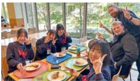
イングリッシュキャンプの様子

世界に羽ばたく人材を育成するため、英語力向上と異文化理解を推進しています。オーストラリア研修や、シンガポール修学旅行、イングリッシュキャンプなど、多様な体験型プログラムが充実しています。グローバル社会に貢献する力を共に磨きましょう。