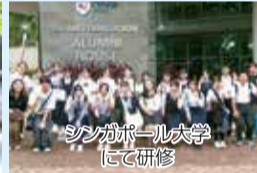
シンガポール大学にて研修

●問い合わせ先 福岡県教育庁教育振興部高校教育課 TEL:092-643-3905