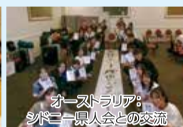
オーストラリア：シボニー県人会との交流