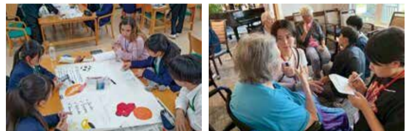
イングリッシュシャワーでの留学生との交流活動

令和7年度はアメリカのフランクリン市を訪問し、地元の高校生との交流や公的施設の見学などを行い、国際的な視野を広げることができました。