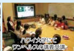
ハワイ大学にてワンヘルスの講義受講