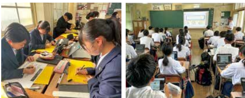
文化祭準備の様子