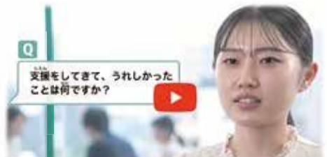
【紹介動画(みらいサポーターへのインタビュー)】