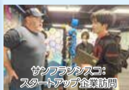
サンフランシスコ：スタートアップ企業訪問