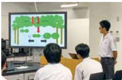
遺伝子工学セミナー