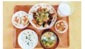
【暑さに負けないさっぱり給食】

「給食レシピコンクール」で入賞でき、光栄に思います。味や栄養のバランスを工夫して作ったレシピを評価していただき、とてもうれしく、これからの自信にもつながりました。