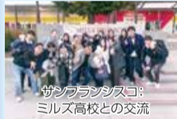
サンフランシスコ：ミルズ高校との交流