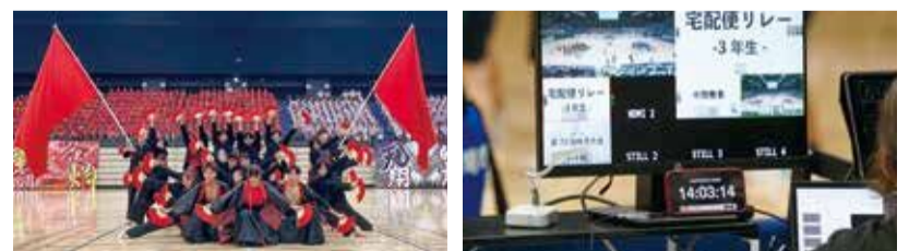
体育大会運営の様子