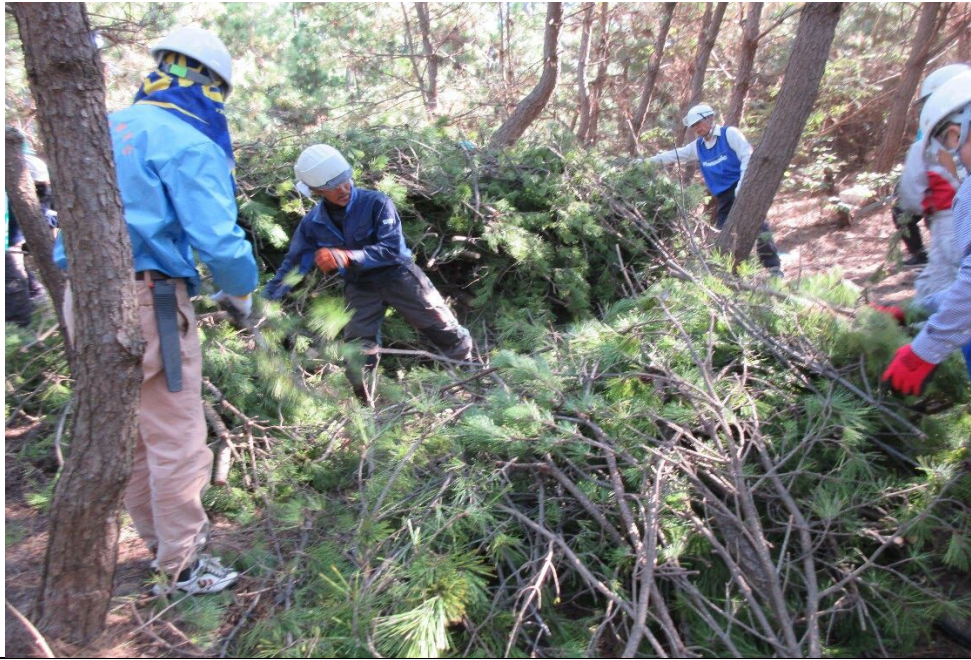
2025/11/8 作業も終焉に 近づく