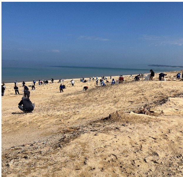
2026/2/28 広い範囲でご みかの散乱