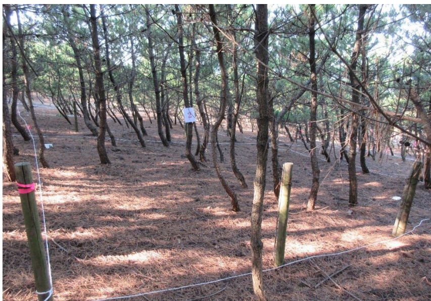
2025/11/8 作業後の風景 木々の間に風 が通り気持ち よさそう