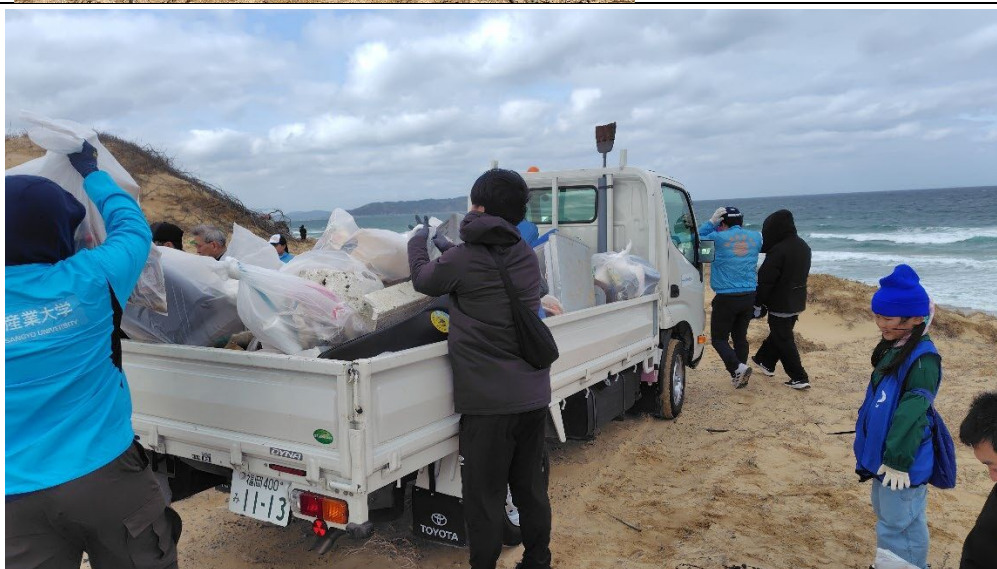
2026/2/28 こんなにゴミ があったのか