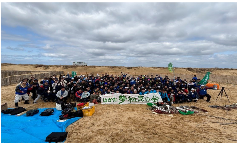
2026/2/28 みなさん、本 当にお疲れ様 でした