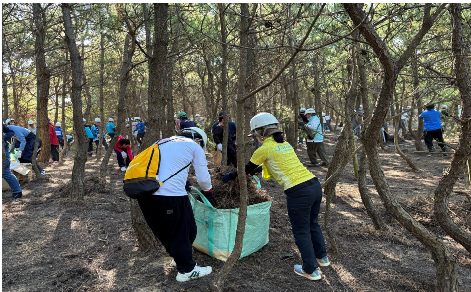
2025/11/8 落葉かき たくさんの帽 子とリュック が見えます