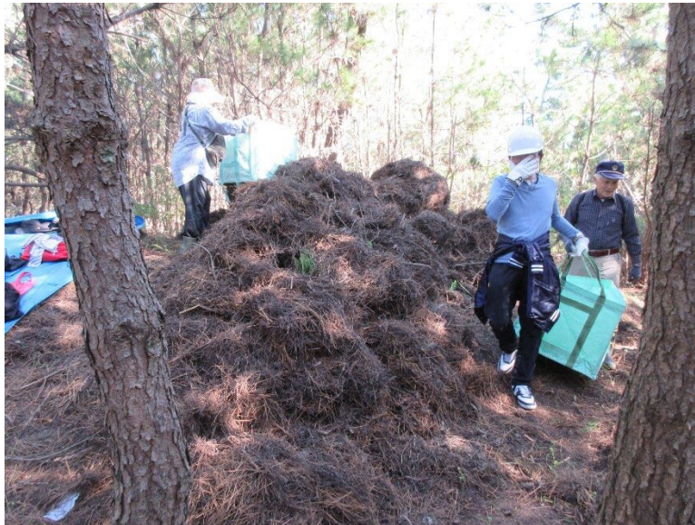
2025/11/8 落葉がこんも りと山積みに