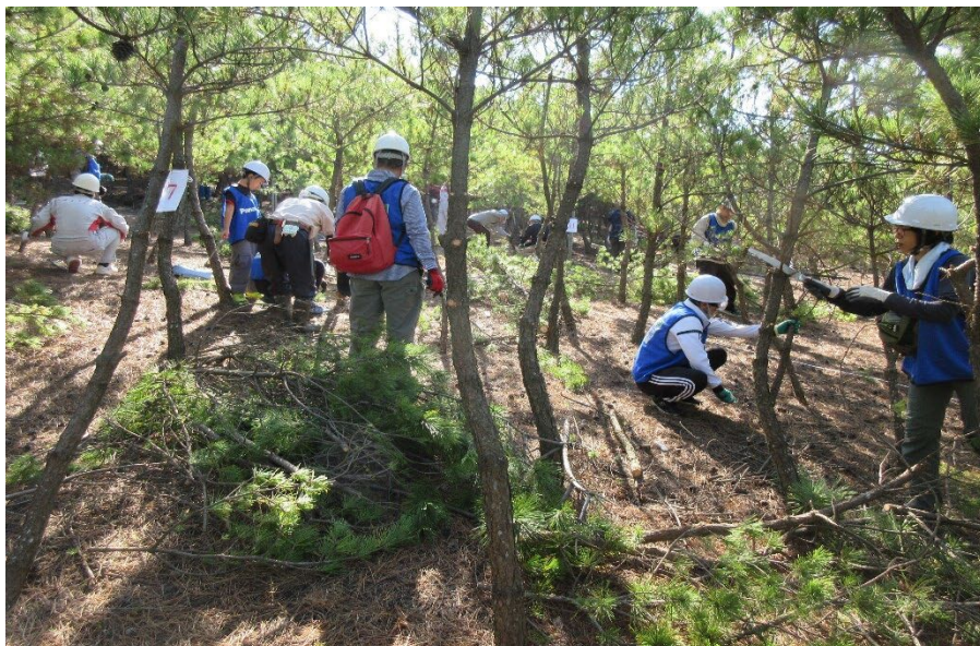
2025/11/8 人の手で一本 ずつ、鋸で間 伐していく