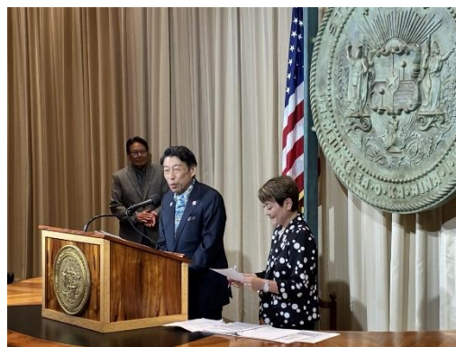
サミットの記者発表