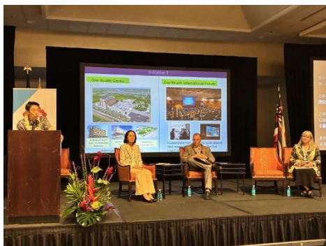
福岡県の取組紹介

ディスカッションを通じて、福岡県・ハワイ州のワンヘルスに関する連携した取組を世界に向けて発信しました。