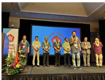
オープニングセレモニーでの知事挨拶

オープニングセレモニーにおいて知事は、「福岡県とハワイ州の姉妹提携が45周年を迎え、これまで様々な交流を展開してきた。2024年には、グリーン知事との間でワンヘルス推進の覚書を締結し、本日、このワンヘルスをテーマとしたパネルディスカッションに、グリーン知事とともに登壇させていただくことを大変意義深く感じている」と挨拶しました。