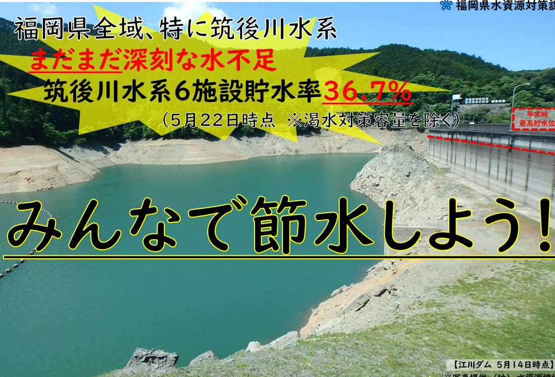
【江川ダム 5月14日時点】