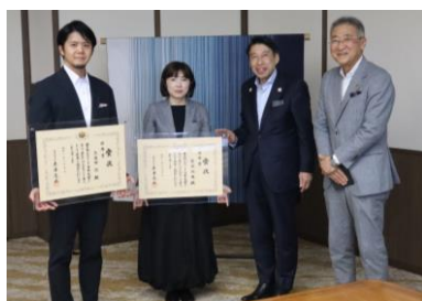
▲知事訪問の様子（5月15日）