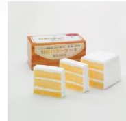
<VISAVIS・特撰バターケーキ>