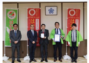
▲知事訪問の様子(4月28日)

【お問い合わせ先】 福岡県商工部 先端技術産業振興課 TEL：092-643-3445 FAX：092-643-3421