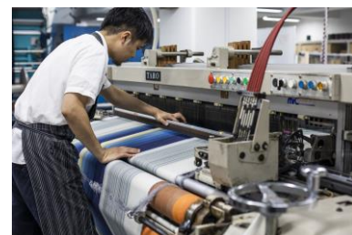
▲小倉織の製造の様子

「小倉織」は経系の密度が緯系の約2倍以上もあり、地厚で丈夫、しなやかな質感の綿織物で、立体的で美しいたて縞のグラデーションが特長。江戸時代から続き、昭和初期に一度途絶えたが、手織りにより再生。現在は、小倉織だけでなく、その伝統技術を基に、ウールと木綿の自然素材を組み合わせたオリジナル生地を開発・製造も行い、革新的なインテリア向けファブリックとして国内外で新市場の開拓を進める。