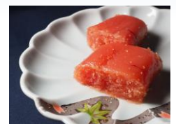
<博多料亭 稚加榮・辛子明太子>