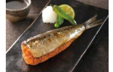
<中島商店・いわし明太子>