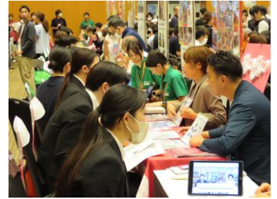
▲昨年度開催したときの様子