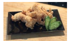
<糸島からあげ大地・からあげ>