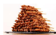
<とり酒場博多華善・とりかわ巻き巻き>