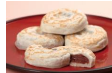
<かさの家・梅ヶ枝餅>