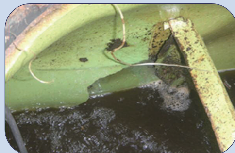
浄化槽が破損し、汚水が漏水している状態

単独処理浄化槽(し尿のみを処理する浄化槽)から、漏水している(汚水が漏れている)など、 そのまま放置すると生活環境の保全や公衆衛生に重大な支障を生じるおそれがある状態にある単独処理浄化槽 を「特定既存単独処理浄化槽」といいます