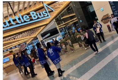
【コンシェルジュ設置初日イベント】