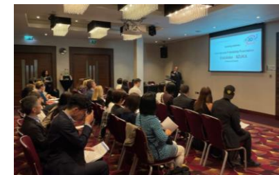
【米国旅行会社のファムトリップ】 【現地での観光セミナー（英国）】