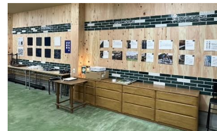
【ギャラリーの整備】