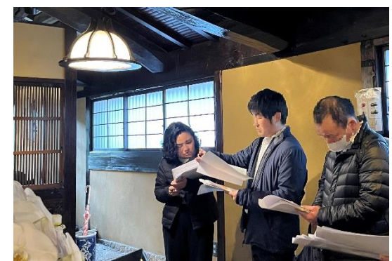
【アドバイザー派遣の様子・施設の設備確認】