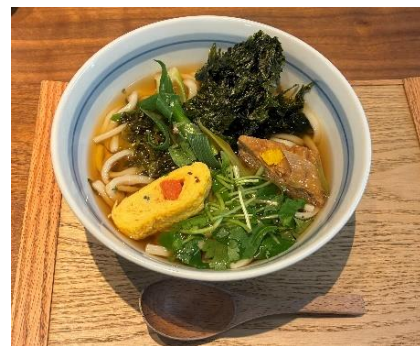
【明太卵焼き入りうどん（ムスリム）】