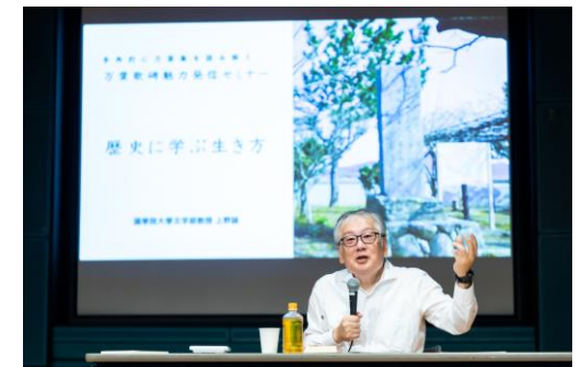
【万葉歌碑魅力発信セミナーの様子】