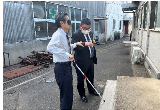
【アドバイザー派遣の様子・白杖の体験】