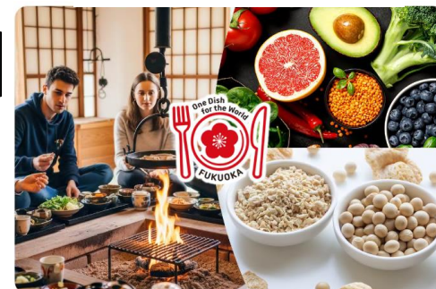
【県観光情報サイト内 対応店舗紹介ページ】