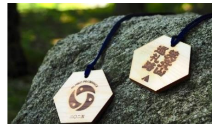
【キャンペーン記念品】