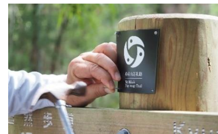
【英彦山巡礼路サイン】