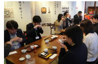
【八女茶のすすり茶体験】

【視察先】 小石原焼、高取焼窯元（東峰村）、夜のいちご狩り（うきは市）、久留米緋工房（広川町）、八女茶すすり茶体験（八女市）、酒蔵、宗像大社（宗像市）