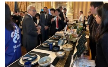
【パリイベントでの様子】