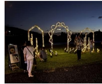
【水辺広場ライトアップ】