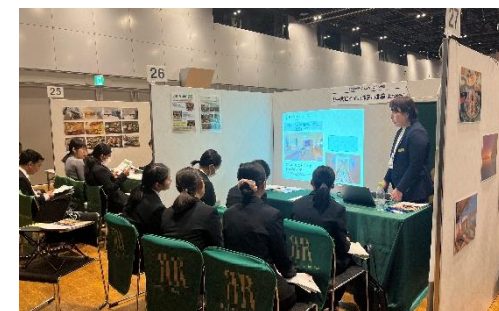
【合同会社説明会の様子】