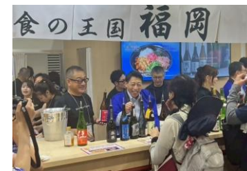
【福岡県のブースの様子】

【期 間】 令和7年9月3日（水）～5日（金） 【会 場】 大阪関西万博会場内 EXPO メッセ「WASSE」