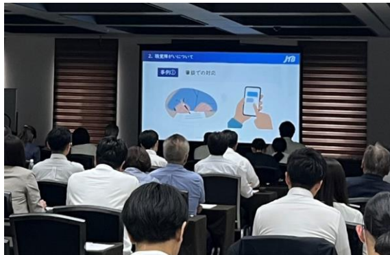
【ユニバーサルツーリズムセミナーの様子】