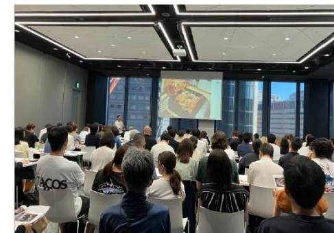
【試食体験セミナーの様子】