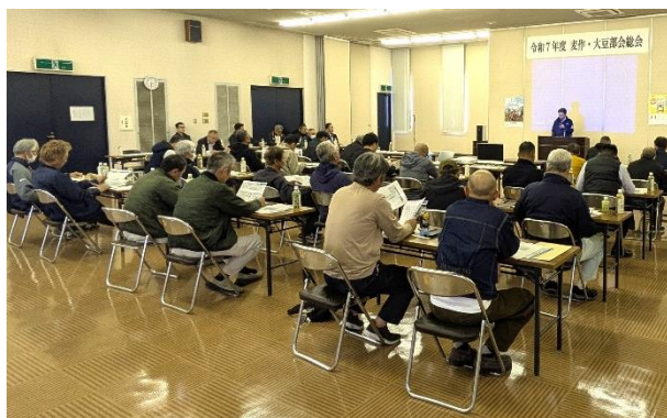
熱心に話を聞く参加者

普及指導センターでは、今後も麦・大豆の高位・安定生産に向け、講習会や実証ほの設置・調査を通じて、生産者を支援していきます。