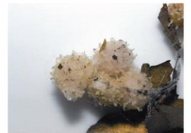
ハイイロゴケグモ (とげがある)