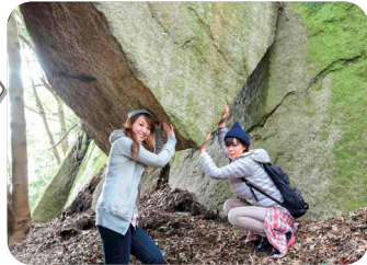
②岩石山「落ちない岩」 ※詳細はホームページでご確認ください。