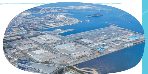
<日産自動車九州(苅田町)>