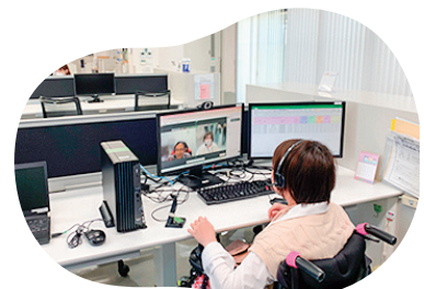
<働きやすい職場のイメージ>

障がいのある人が活躍する職場の見学ツアーと、企業の受入環境の改善を助言するアドバイザー派遣により、働き続けたい職場づくりを支援