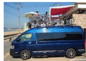
家康観光「サイクルチャーター」