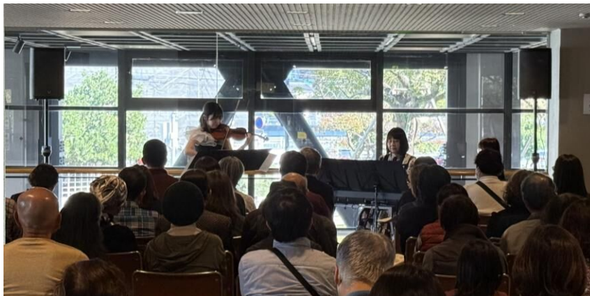
2025.11.15 アクロス・ミュージックキャラバン in 福岡県立美術館 より

アクロス・ミュージックキャラバンは、文化活動の活性化を目的に、アクロス福岡が県内の美術館、博物館、科学館等のミュージアム、県内市町村施設や、天神周辺地域の施設と連携して開催するコンサートです。今回は、『人生はよろこばせごっこ やなせたかし展』での開催となります。