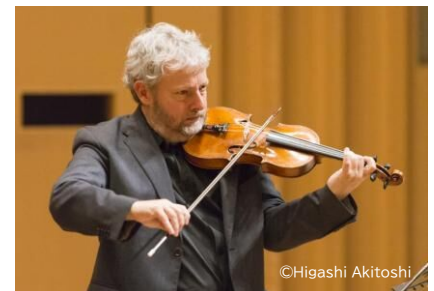
ファビオ・ビオンディ