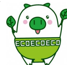
福岡県マスコットキャラクター 「エコトン」

福岡銀行、西日本シティ銀行、筑邦銀行、福岡中央銀行、佐賀銀行、北九州銀行、十八親和銀行、熊本銀行、佐賀共栄銀行、西京銀行、豊和銀行、三菱UFJ銀行、三井住友銀行、福岡信用金庫、福岡ひびき信用金庫、大牟田柳川信用金庫、筑後信用金庫、飯塚信用金庫、田川信用金庫、大川信用金庫、遠賀信用金庫、福岡県信用組合、横浜幸銀信用組合、商工組合中央金庫（以上24金融機関）