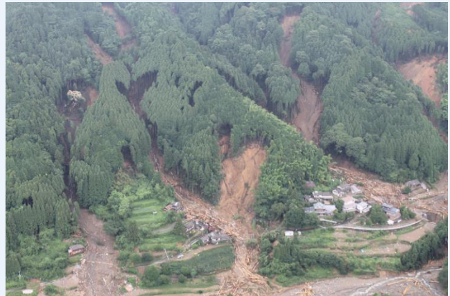
平成29年7月九州北部豪雨（朝倉市）