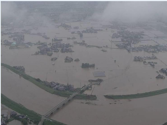
平成24年7月九州北部豪雨（柳川市）