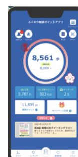
(写真) ふくおか健康ポイントアプリの画面

本県も運動に取り組みやすい環境づくりを推進しており、県が配信する「ふくおか健康ポイントアプリ」では、歩数記録や健康記録（体重、血圧、食事バランス、運動実施状況など）、イベント参加等によるポイント付与を通じて、運動の習慣化を促す施策を実施している。また、令和 7 年 1 月には WEB サイト「ふくおか健康ポイント+」を開設し、継続しやすい運動メニューや健康コラムなどの情報提供、適したトレーニングの診断など、スポーツ・運動習慣の定着に向けた情報発信を行っている。