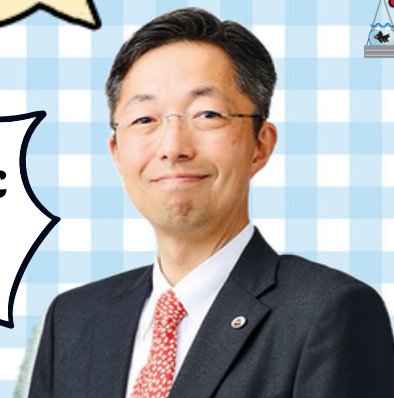
熊本県知事 木村 敬