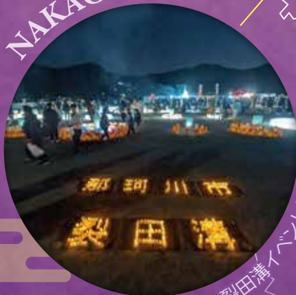
裂田溝イベント状況