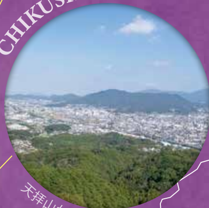
天拝山からの風景