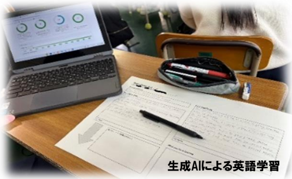
生成AIによる英語学習