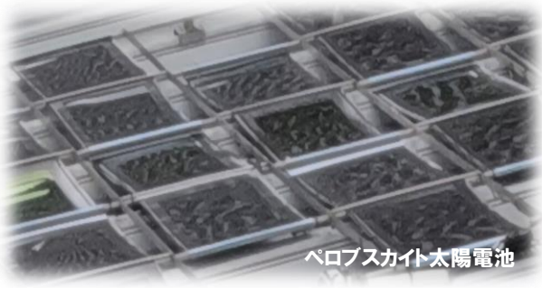
ペロブスカイト太陽電池