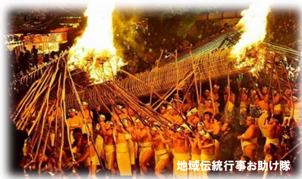
地域伝統行事お助け隊