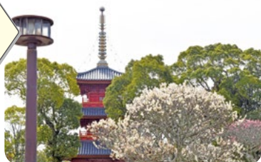
②豊前国分寺跡公園の梅