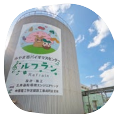
バイオマスセンター「ルフラン」

マス資源として循環するための施設。館内にはカフェやコワーキングスペースもあります。