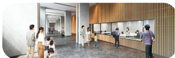
▲県産木材を活用した温かみのあるエントランス