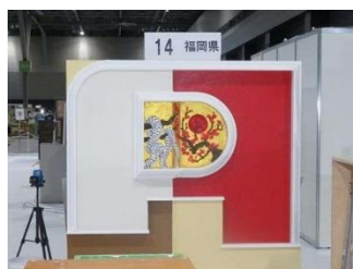
◀ 左官職種作品 （技能五輪）