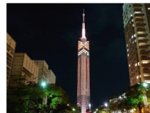
福岡タワー (福岡市早良区百道浜2丁目3番26号)

※福岡タワーは9月21日のみ、旧福岡県公会堂貴賓館は9月21日・22日のみライトアップ