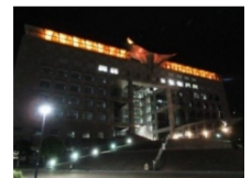
クローバープラザ (春日市原町3丁目1-7)