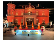
旧福岡県公会堂貴賓館 (福岡市中央区西中洲6番29号)