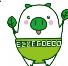
福岡県マスコットキャラクター 「エコトン」

福岡銀行、西日本シティ銀行、筑邦銀行、福岡中央銀行、佐賀銀行、北九州銀行、十八親和銀行、熊本銀行、佐賀共栄銀行、西京銀行、豊和銀行、三菱UFJ銀行、三井住友銀行、福岡信用金庫、福岡ひびき信用金庫、大牟田柳川信用金庫、筑後信用金庫、飯塚信用金庫、田川信用金庫、大川信用金庫、遠賀信用金庫、福岡県信用組合、横浜幸銀信用組合、商工組合中央金庫（以上24金融機関）